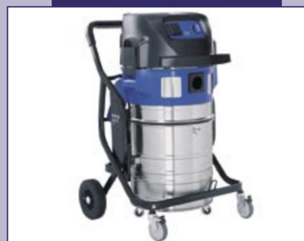
Attix 965-21 SD XC

Met 2 krachtige motoren, roestvrijstalen reservoir met hefmechanisme, automatisch filterreinigingssysteem en een groot filteropvlak, kan er snel en efficiënt vuil verwijderd worden.