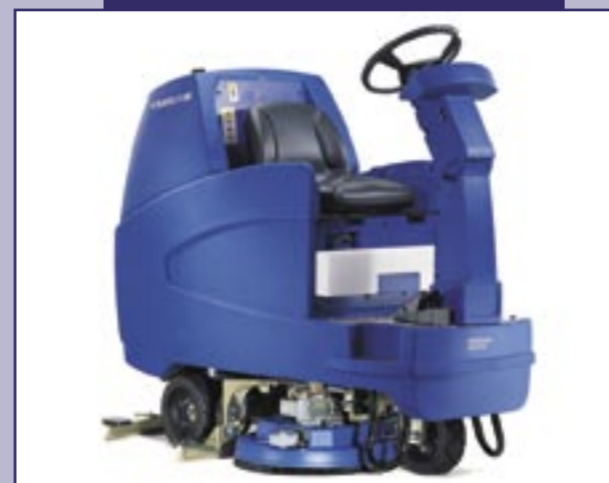
Scrubtec R 586

Deze schrobmachine is bijzonder compact en stabiel, de ideale oplossing voor al uw reinigingswerkzaamheden. De machine kan door verschillende borstels, pads en andere opties aan uw specifieke reinigingseisen worden aangepast. De Scrubtec is in 3 uitvoeringen leverbaar.