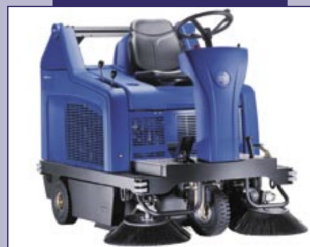
Floortec R 680 B

Ideaal voor het stofvrij vegen van grote oppervlakten. Een krachtige zuigmotor, grote capaciteit, hydraulische hoogglanssysteem en een 130 liter vuilreservoir zorgen ervoor dat deze vloerreiniger doet wat hij moet doen.