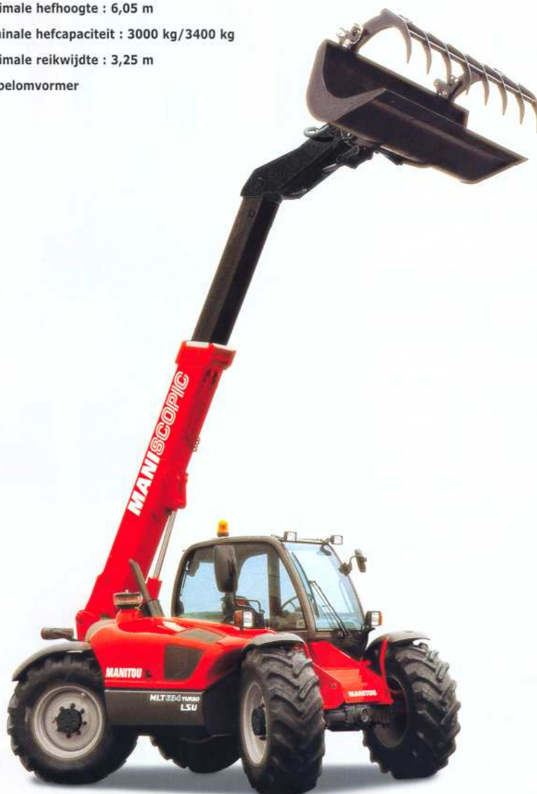
MLT 634 TURBO LSU - CBG standaard 2450