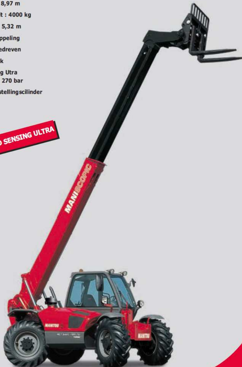
MLT 940 L - 120 LSU - TFF 45 MT 1040